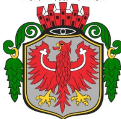
Herb miasta Barlinek