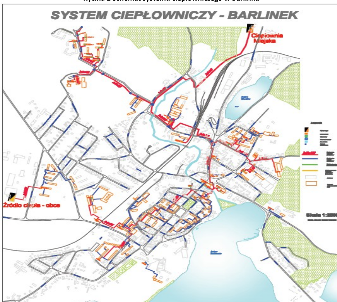
Rycina 2 Schemat systemu ciepłowniczego w Barlinku

Na terenie miasta i gminy funkcjonuje Przedsiębiorstwo Energetyki Ciepłej spółka z o.o. System ciepłowniczy miasta Barlinek jest eksploatowany od roku 1992.