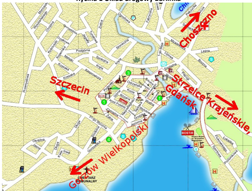
Rycina 1 Układ drogowy Barlinka